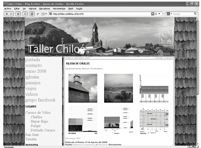
Figura 1. Sitio web del Programa/Taller Chiloé.

la comunidad, distante unos 1200 kms. de la facultad de arquitectura (Fig. 1). De esta forma, usuarios directos, autoridades, ONGs y privados pueden efectuar observaciones o modificaciones a los proyectos consultados a medida que éstos se van desarrollando. Adicionalmente, y como parte de estas actividades, se pretende organizar entre los participantes algunas asambleas breves no presenciales coordinadas mediante el sitio web, y es en dicho requerimiento específico que surge la posibilidad de utilizar la AR para presentar los proyectos