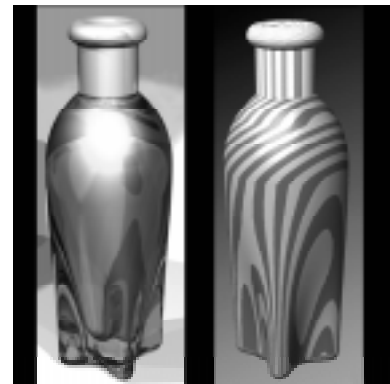
Fig 5: Imagen fotorealista y análisis de continuidad

Otra característica es que el CAD permite incorporar información no visual tal como el análisis de la curvatura o la continuidad de las superficies o el cálculo del volumen de los envases. Esta interacción es importante ya que permite realizar correcciones y comprobaciones más allá del dibujo, estableciendo vínculos entre las variaciones de forma y los cambios en su comportamiento no visual.