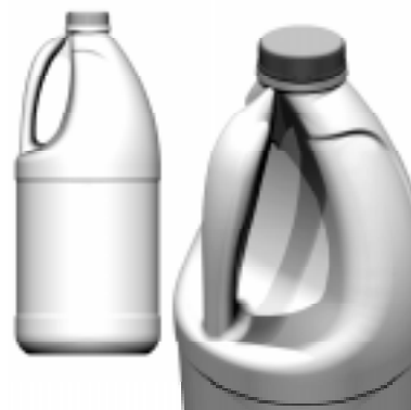
Fig 4: Imagen fotorealista y detalle de envase

En una instancia final, los renderings de computadora enfatizan la simulación y el realismo fotográfico, permitiendo verificar el ajuste y desarrollo de lo que se expresó en un primer dibujo a mano.