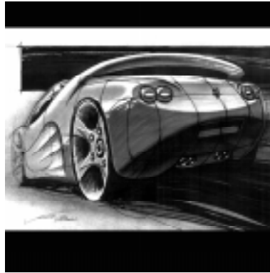
Fig 3: Rendering a mano

Permiten también vincular instancias de producción y de evaluación y modificación en reuniones de trabajo, ya que no requiere más equipo que algún elemento de dibujo y un papel.