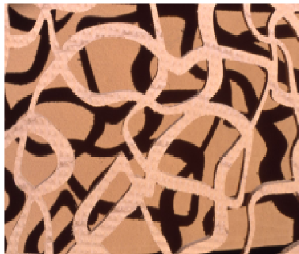
Fig 3 - La tecnología dispuesta en la dirección correcta permite construir “de verdad” mediante procesos íntegramente digitales (panel de pabellón digital realizado en la ESARQ con la máquina CNC, Bernard Cache, Barcelona, 2001 – foto: A. Estévez)

A escala uno/uno, diseñado y producido todo él cibernéticamente, con la infraestructura de última tecnología que dispone la ESARQ: máquinas de CNC y de MJM guiadas por programas aplicados por primera vez a la arquitectura. Por que ahí está la clave, hacer viable para la edificación real la conexión entre el diseño del ordenador y su producción a máquina. Algo que también ahora ya es posible: una construcción física, robotizada y que puede hasta ser permanente... una torre de Babel hecha realidad.