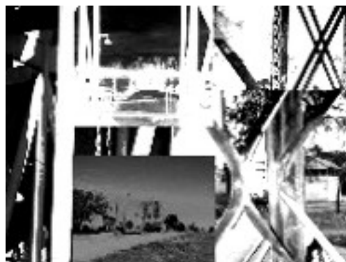
Fig1. Agenciamiento exploratorio urbano.

Introducir a la problemática de la percepción, los nuevos constructos de la misma, sobrevolando las actuales interfases analógicas-digitales desde la perspectiva de la neopercepción.