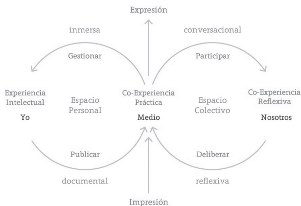
Fig. 3. El modelo MF propone una configuración de experiencias en cadenas articulando una co-experiencia social de democracia. El acoplamiento del feedback construye el sentido de la acción y vuelve trascendente la experiencia personal.

Sobre la motivación y el incremento en la sinergia de las conversaciones, hacer público un perfil ciudadano de acuerdo al nivel de participación, genera una reputación e influencia que desincentiva la publicación de información banal. Cada persona con su identidad ciudadana, del mismo modo que lo hace con su perfil en las redes sociales ya que forma parte del mismo ecosistema. Distinguir la participación a través del reconocimiento de personas, aumenta la relación horizontal y la importancia del empoderamiento cívico a través de la representatividad (Sartori, 2009).