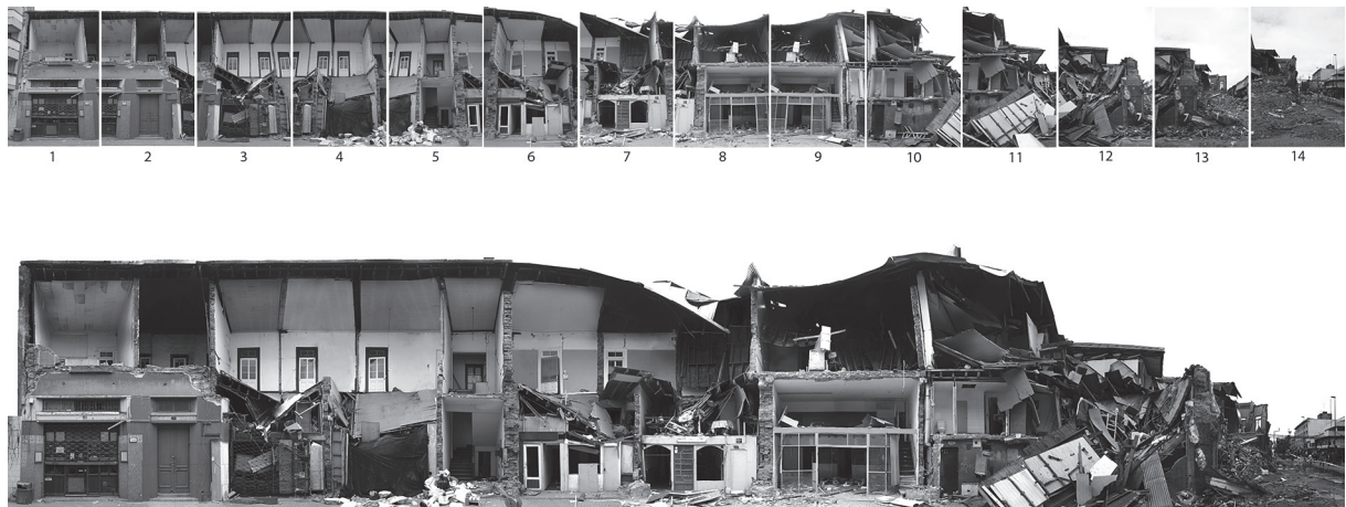
Fig. 3. Fotografía y su proceso de construcción. El edificio corresponde a la fachada suroeste del pasaje Aurelio Manzano en Concepción. Fue uno de los colapsados por el terremoto que estaban contruidos a base de ladrillo a principios del siglo XX. Impresa para De-hechos en un tamaño de 0,4x2 mts, la imagen final puede ser impresa a 1, 2x6 mts. que correspondería