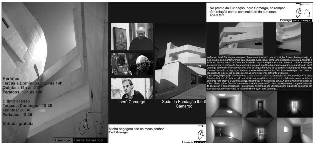
Figura 01 – Layout do Itinerário Virtual Cultural a ser disponibilizado em smartphones.

Todos os textos que são relacionados a outros sites possuem uma coloração distinta. Podem ser acessados através da parte inferior do dispositivo, como pode ser visto na figura 02.