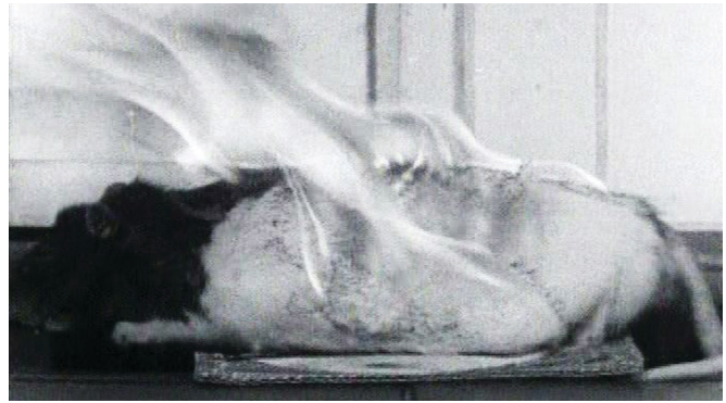
Figura 1 y 2: Fuego inextinguible (1969). Film b/n, 25 min.

La progenie de esa batalla es nutrida y deriva en la necesidad de transferir la hermeneútica o la semiótica del texto a la "lectura" de los artefactos visuales, y de "leer" la imagen con los saberes de la lectura del texto. "Según el saber como problema" escribe Deleuze a propósito de Foucault, "pensar es ver y es hablar, pero pensar se hace en el 'entre dos', en el intersticio o la disyunción del ver y del hablar. Pensar es inventar cada vez el entrelazamiento, lanzar cada vez una flecha desde uno mismo al blanco que es el otro, hacer que brille un rayo de luz en las palabras, hacer que se oiga un grito en las cosas visibles." (Speranza, 2006: 23-24)