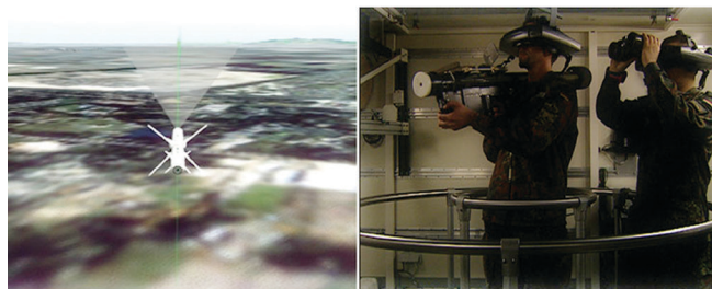
Figura 3: Ojo/Máquina II (2002). Video, color y b/n, versión de un solo canal, 15 min.

los lenguajes del arte el dispositivo para problematizar las gramáticas situaciones aprendizajes y abrimos a experiencias estéticas profundamente educativas.